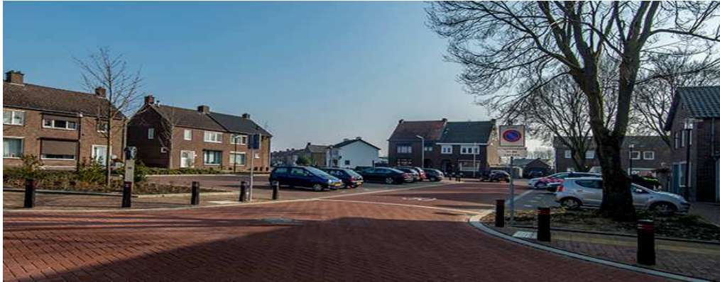
Gebiedsgerichte aanpak buurt Soestdijk

Gebiedsgerichte aanpak werpt zijn vruchten af. Pleinen zijn eyecatchers en verdienen een mooie aanblik in onze gemeente. Nu het centrumplan in Stein nagenoeg afgerond is, mag de focus verlegd worden naar de centra van de overige kernen verlegd worden. Het St. Antoniusplein in Urmond, het Dorine Verschureplein in Elsloo en het Beatrixplein in Berg aan de Maas dienen opgeknapt te worden.