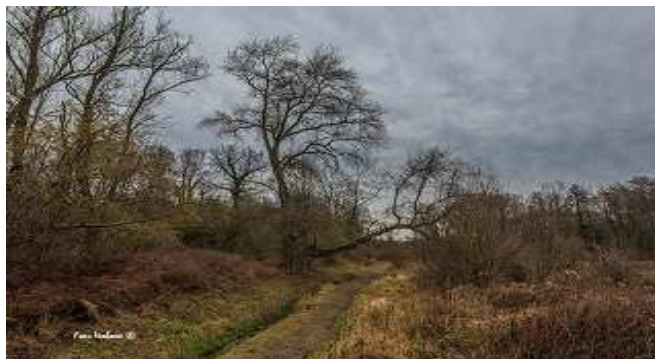
Wandelgebied 't Brook

Anderzijds moeten we onze woonbuurten niet meer dan strikt noodzakelijk, of liever in het geheel niet belasten met vrachtverkeer. Afwikkeling van vrachtvervoer buiten de bebouwde kom is daarom onze inzet. De bestaande overlast (geluid, geur, veiligheidsrisico's) mag daarbij niet toenemen. Het gebied Paalweg is dringend aan een upgrade toe. CDA wil dit graag in de komende bestuursperiode aangepakt zien.